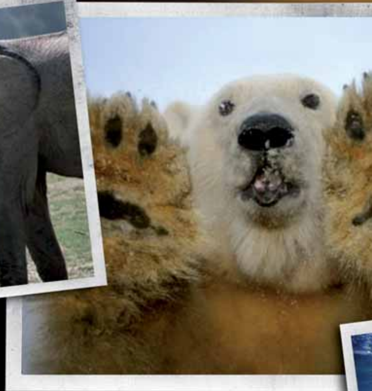
Beelden uit de film Earth.